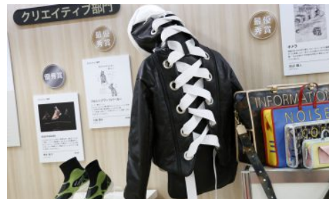
<2017年クリエイティブ部門：最優秀賞作品>

今回で8回目となる同コンテストはファッション、生活雑貨、インテリアなどの分野で、革製品の新しい価値を生み出すようなアイデアのデザインを募集し、その内容を競うものになります。コンテストはデザイン画のみの「クリエイティブ部門」と、実製作まで行う「プロダクト部門」の2部門に分かれております、応募条件は革素材を全体の70%以上で表現したもので、未発表のオリジナル作品に限ります。第99回 TLFにて、表彰式を開催し、受賞作品を展示致します。